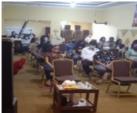
Gambar 3. Pemaparan Materi Pemasaran Digital

Pemasaran digital dianggap solusi bagi masyarakat era modern adalah karena rata-rata penduduk Indonesia telah memiliki ponsel pribadi, tercatat pada 2021 berdasarkan data dari wearesocial jumlah pengguna ponsel di Indonesia dan digunakan untuk mengakses internet adalah sejumlah 195,3 juta pengguna (Kemp, 2021). Pada pemasaran digital ini juga disampaikan mengenai konsep Society 5.0 dimana kombinasi antara manusia, informasi dilengkapi dengan infrastruktur teknologi terbarukan dalam bisnis menjadi salah satu bentuk inovasi yang terus berkembang. Digitalisasi UMKM tidak hanya membutuhkan kreativitas dan inovasi saja namun perlu juga didukung oleh kebijakan dan pengambilan keputusan yang tepat, hal ini diperlukan agar UMKM memiliki keunggulan untuk dapat menembus pasar global dan memiliki dampak jangka panjang secara positif berkelanjutan dan akhirnya berkontribusi pada peningkatan ekonomi (Sugiono, 2020).