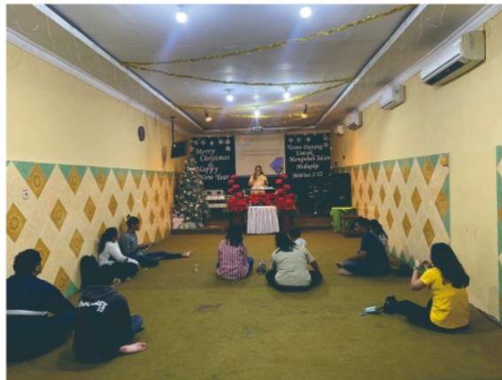
Gambar 2. Pemaparan Materi Dalam Kelompok Kecil

Pada materi pertama mengenai pelatihan kewirausahaan dilakukan dengan cara menyampaikan materi dalam bentuk slide power point dan bentuk kelompok-kelompok kecil yang terbagi dalam tiga sesi dengan maksud agar penyampaian materi yang diberikan dapat diterima dengan baik oleh peserta. Pemilihan power point sebagai media juga karena berdasarkan literatur dari (Osman et al., 2022) power point merupakan alat yang paling efektif dan atraktif dimana didalamnya dapat terjadi integrasi meliputi teks, grafik, animasi dan video. Pada sesi ini pemateri juga memberikan kesempatan kepada peserta untuk sharing atau membagikan kesulitan dan kendala mereka saat berusaha.