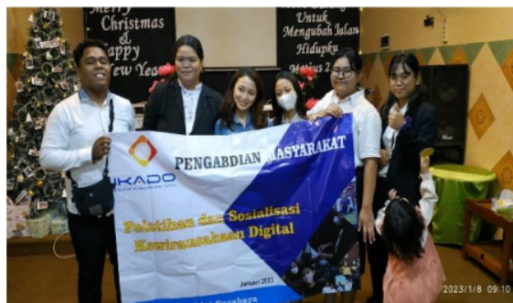
Gambar 5. Foto Bersama Perwakilan IKADO Surabaya dan Mitra Gereja El-Shaddai Surabaya

Pada tahapan evaluasi yang dilaksanakan di akhir acara di berikan sesi tanya jawab dan diskusi dari peserta, pada tahapan ini digunakan metode wawancara terhadap peserta, untuk mendapatkan masukan yang akan digunakan terhadap kegiatan selanjutnya, setelah sesi wawancara maka pada tahapan selanjutnya dilanjutkan dengan sesi foto bersama bersama perwakilan antara perwakilan dari Institut Informatika Indonesia dari mitra peserta pelatihan.