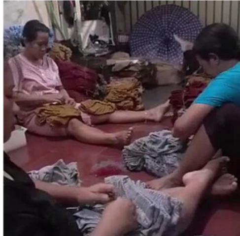
Gambar 4. Pendampingan Pelatihan Bagi Masyarakat

sederhana misalnya dari industri rumah tangga atau pasar kecil yang kemudian meningkat ke pasar yang lebih besar besar (perluasan pangsa pasar) hingga mampu menggeser pasar konvensional yang sudah ada sekaligus juga dapat merubah secara drastis proses bisnis dari sebuah organisasi/perusahaan. Maka dapat disimpulkan bahwa hal ini pun dapat menjadi hambatan dan tantangan jika pelaku UMKM tidak mampu menyesuaikan terhadap perubahan yang ada (Khairin et al., 2021).