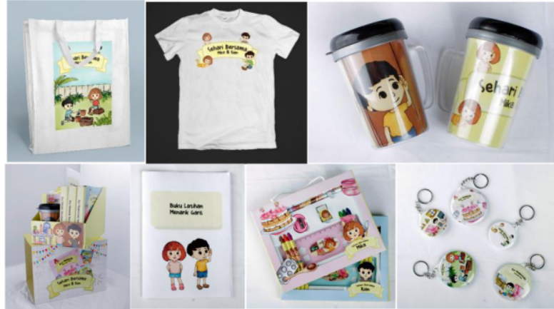
Gambar 12. Merchandise