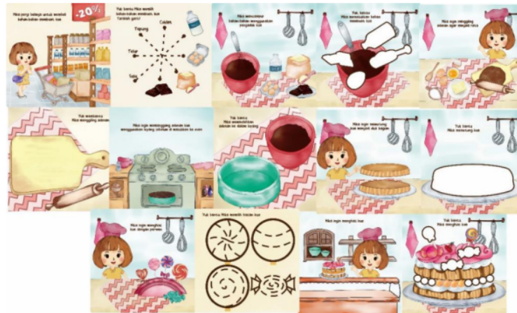
Gambar 5. Tampilan Buku Ayo Memasak Bersama Mika