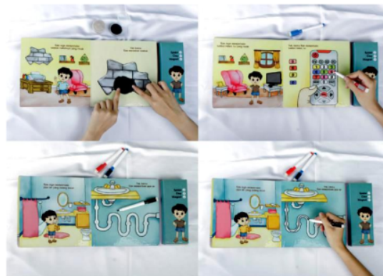
Gambar 9. Simulasi Buku Ayo Memperbaiki Bersama Rian

Bentuk interaktif yang terdapat pada buku ini adalah mencocokkan bentuk, menarik garis, menyusun puzzle , menempel, menggambar dll, yang akan merangsang kemampuan motorik anak. Ketiga buku ini dirancang untuk dibaca dan dikerjakan oleh anak, akan tetapi orang tua, baik ayah atau ibu, diharapkan mendampingi buah hatinya dalam proses pembelajaran agar terciptanya kedekatan hubungan antara orang tua dengan anak.