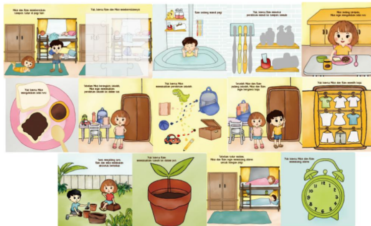
Gambar 2. Tampilan Buku Ayo Mandiri Bersama Mika & Rian