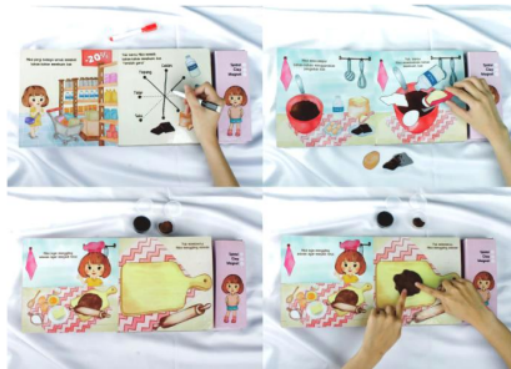
Gambar 6. Simulasi Buku Ayo Memasak Bersama Mika

Seri buku ketiga “memperbaiki benda-benda di rumah” diawali dengan menemukan barang yang rusak lalu lalu memperbaikinya dengan keinginan sang anak tersebut. Hal-hal yang diajarkan dalam buku ditujukan untuk membangun kepekaan dan keinginan anak untuk memulai berinisiatif tanpa harus disuruh.