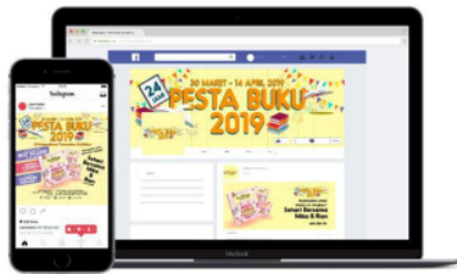
Gambar 11. Sosial Media Pendukung Promosi Buku