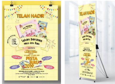
Gambar 10. Media Pendukung Promosi Buku: Poster & Stand Banner

Media Pendukung berupa media promosi dan merchandise untuk mendukung penerbitan dan penjualan. Poster dan stand banner launching (gambar 10) digunakan ketika pertama kali buku diterbitkan secara onsite di toko buku, seminar, atau acara lainnya. Informasi juga dibagikan melalui sosial media yang kebanyakan sedang dikonsumsi oleh khalayak umum seperti Facebook dan Instagram (gambar 11). Selanjutnya, merchandise yang digunakan adalah benda-benda yang sering kali dibutuhkan anak dalam proses pembelajaran baik di dalam maupun di luar rumah seperti worksheet , alat tulis, tote bag , t-shirt , tumbler , dan gantungan kunci (gambar 12). Untuk merchandise alat tulis dan tumbler sebagai bonus penjualan tiga seri buku, sedangkan merchandise lainnya melalui penjualan terpisah. Terakhir, booth pameran (gambar 13) dipersiapkan untuk memperkenalkan semua karya perancangan ini kepada konsumen.