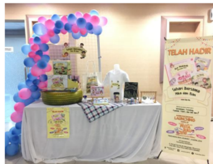
Gambar 13 Stand Pameran