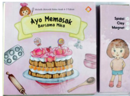
Gambar 4. Cover Buku Ayo Memasak Bersama Mika

Seri buku kedua dengan spesifik aktivitas domestik “memasak” bersama Mika (gambar 5), mulai dari belanja bahan, membuat kue hingga mendekorasinya.