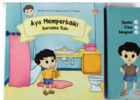
Gambar 7. Cover Buku Ayo Memperbaiki Bersama Rian

Seri buku ketiga “memperbaiki benda-benda di rumah” diawali dengan menemukan barang yang rusak lalu lalu memperbaikinya dengan keinginan sang anak tersebut. Hal-hal yang diajarkan dalam buku ditujukan untuk membangun kepekaan dan keinginan anak untuk memulai berinisiatif tanpa harus disuruh.