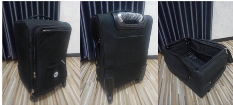
Gambar 3. Desain Koper Kabin

timeless . Selain itu, material dengan tekstur halus juga memudahkan pembersihan serta menjaga estetika koper dalam jangka panjang. Dari perspektif desain minimalis, kesederhanaan tidak hanya meningkatkan estetika tetapi juga memberikan pengalaman pengguna yang lebih intuitif dan efisien (Norman, 2013). Dengan kombinasi ergonomi dan estetika, koper minimalis dapat memenuhi kebutuhan pengguna modern yang mengutamakan kepraktisan dan gaya.