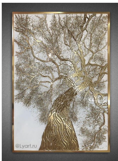
Gambar 4. Pohon Midas