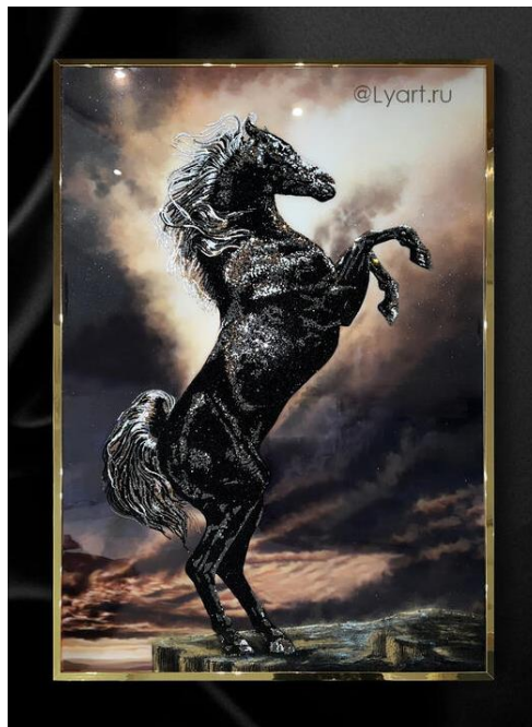
Gambar 3. Kuda Arab