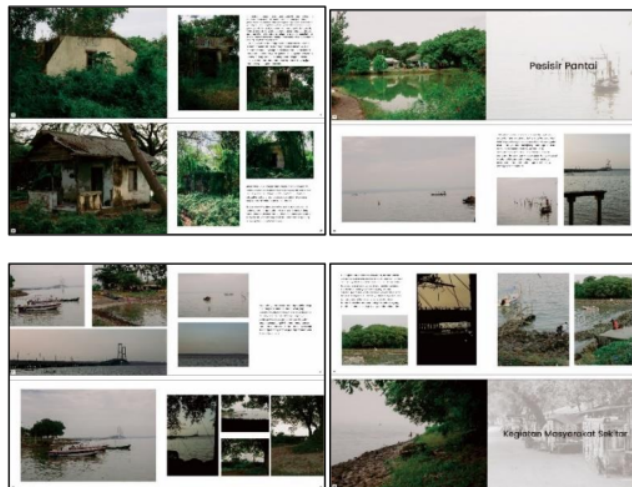
Gambar 8. Proses Digital Layout

Dalam proses pengerjaan digital layout buku, digunakan Corel Draw dengan mengatur layout sesuai dengan sketsa yang telah dibuat.