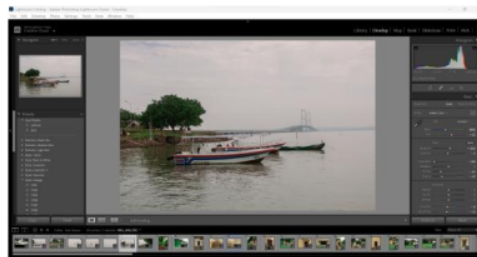
Gambar 6. Proses Editing Foto

Perancangan ini menggunakan proses editing foto dengan menggunakan software Adobe Lightroom. Olah digital atau editing dilakukan untuk memperbaiki dan menyempumakan komposisi foto serta untuk mengatur kontras, saturasi, pencerahan dan warna foto agar lebih maksimal.