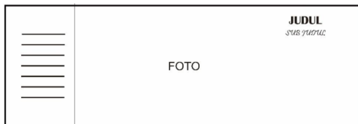
Gambar 4. Sketsa Cover Buku

Sketsa yang telah dibuat menggabungkan antara hasil foto dan tulisan seperti judul buku, sub judul, elemen, sejarah benteng, nama pengarang, dan tahun pembuatan buku sehingga akan menampilkan style layout minimalis.