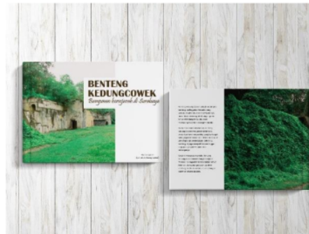
Gambar 1. Foto Esai