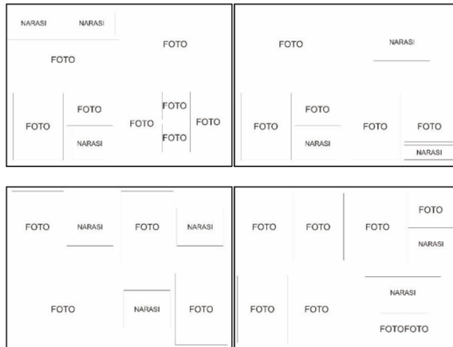
Gambar 5. Sketsa Layout Buku

Layout di desain menarik dengan menampilkan beberapa foto dengan narasi dan beberapa foto full 1 halaman, dengan pembagian sub judul menjadi 3 sub judul guna untuk memisahkan beberapa konteks foto yang berbeda.