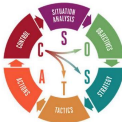
Gambar 2. Model Perencanaan SOSTAC [15]