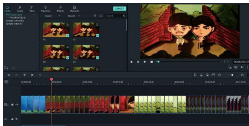
Gambar 3. Proses Penyuntingan Gambar

Proses pasca produksi yang terdiri dari empat proses yaitu (1) penyuntingan gambar dengan menggunakan Filmora 9 dengan menyusun hasil gambar sesuai dengan storyboard yang sudah disusun; (2) penyuntingan audio dengan memasukkan latar musik berupa gending Jawa, efek suara pendukung, voice over berbahasa Indonesia dengan alat Zoom H1N ; (3) penyuntingan subtitle dengan menggunakan naskah cerita yang sudah dibuat dalam bahasa Indonesia.