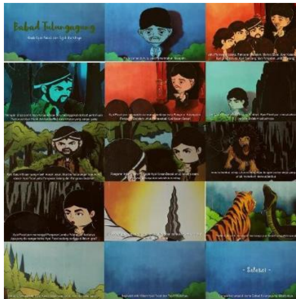
Gambar 5. Visual Video Stop Motion

Tahap implement adalah hasil visual desain akhir pada video stop motion trailer version dan video stop motion full version (lima serial video dengan durasi 5 menit per video) yang dipublikasikan di media digital YouTube .