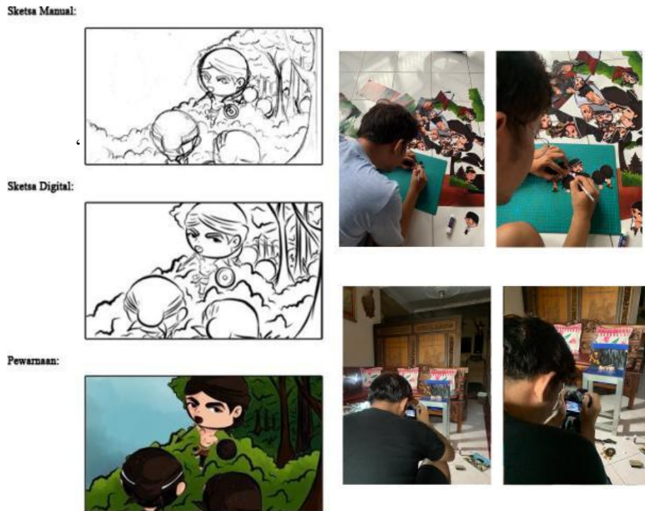
Gambar 2. Proses Produksi

Proses pasca produksi yang terdiri dari empat proses yaitu (1) penyuntingan gambar dengan menggunakan Filmora 9 dengan menyusun hasil gambar sesuai dengan storyboard yang sudah disusun; (2) penyuntingan audio dengan memasukkan latar musik berupa gending Jawa, efek suara pendukung, voice over berbahasa Indonesia dengan alat Zoom H1N ; (3) penyuntingan subtitle dengan menggunakan naskah cerita yang sudah dibuat dalam bahasa Indonesia.