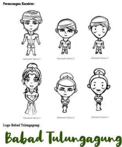
Gambar 1. Karakter & Logo